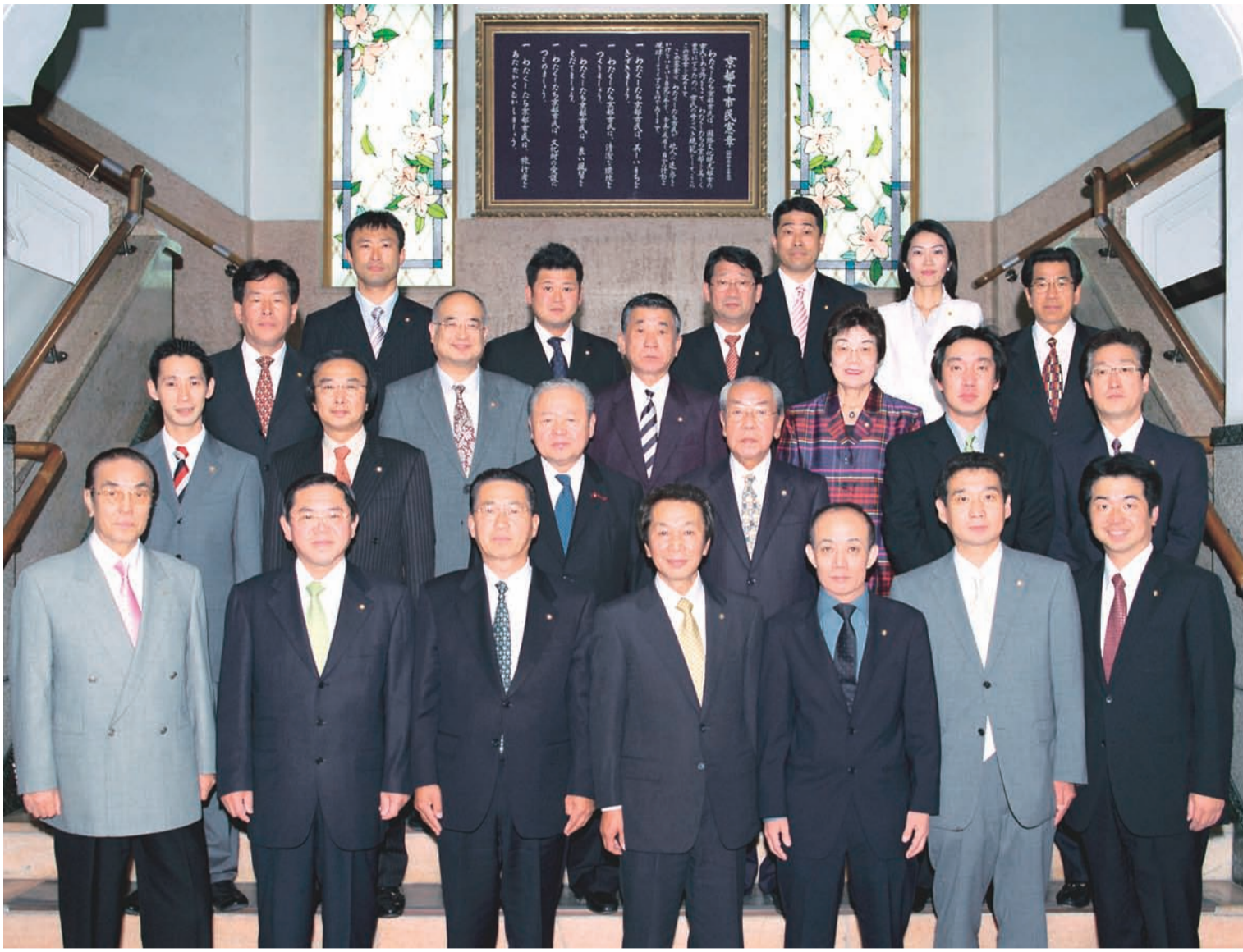
市役所庁舎玄関の京都市市民憲章額前に勢ぞろいした自民党市会議員団