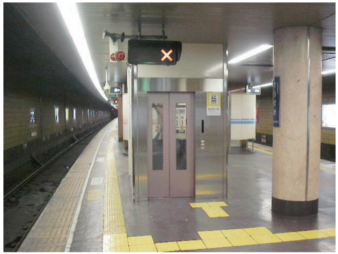
改札階を結ぶエレベーターが設置された阪急烏丸駅ホーム

に、十四の重点整備地区のうち八地区で移動円滑化基本構想を策定し、十二の旅客施設において、エレベーター設置などバリアフリー化を着実に進め、今年度中にはすべての地区で事業化に着手し、二十二年年度まで