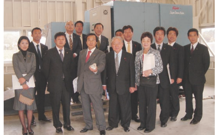
新潟市と金沢市を行政調査した自民党議員団一行

自民党議員団は十月十六日、十七日の両日、他都市行政調査(新潟市、金沢市)を行いました。(新潟市では本年五月に新しく完成した中央卸売市場を調査、広大な敷地に鮮魚、青果、花きの市場がそれぞれ配置されてお