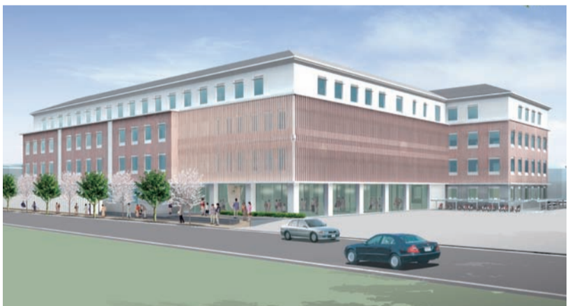
待ち望む伏見区総合庁舎の完成予想図

観光地を中心とした渋滞の緩和については、秋の観光ピーク期に嵐山及び東山地区において、来訪される自動車の総量をできるだけ少なくする、パーク&ライド等の取り組みを行っており、その結果、交通の円滑化が図られ、自動車交通を中心とした運輸部門の排出量が全体の約二割を占める温室効果ガス排出量の削減