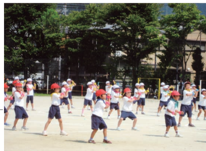
子どもから信頼され、模範となる行動を（市民憲章）

く国に要望して参ります。また、財政健全化プランを達成するために、引き続き、民営化や民間委託のほか、PFI、指定管理者制度などの導入に積極的に取り組み、聖域なき行財政改革を断行して参ります。