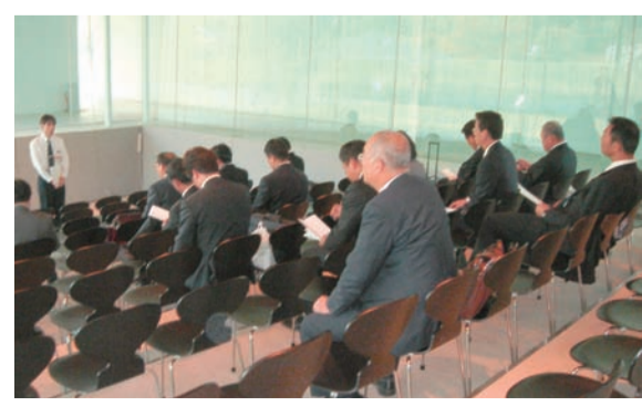
21世紀美術館で説明を聞く議員団

りました。中でも我々が特に注目したのは、場内に設置されている発泡スチロールのリサイクル施設と生ごみ処理施設でした。場内で発生するゴミを場内で処理するという考えは今後広まるだろうと思われま