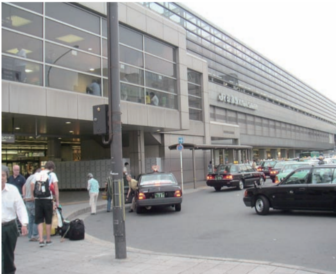
総合的な整備計画が検討される京都駅南口広場前