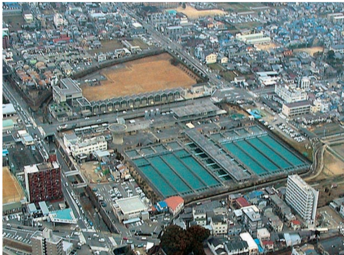
跡地の活用が注目される山ノ内浄水場

（質問）山ノ内浄水場跡地を活用して、右京区のみならず京都市全体にとり有効なものとなり、また、地下鉄の乗客数の増加につながる方策を、市民の知