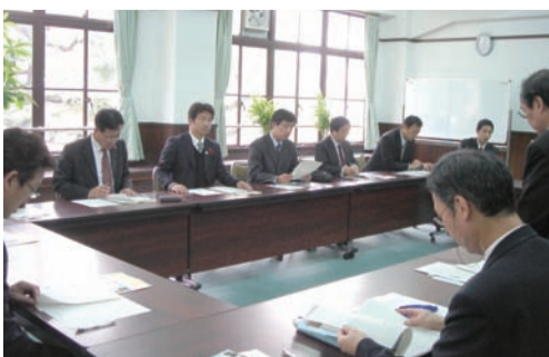
門川大作教育長より説明を受ける