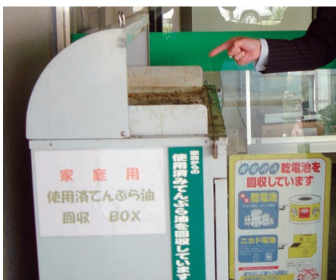
拡大が望まれる廃食用油の回収拠点

皆様の身近にあり、いつでも利用できる回収拠点の設置は、有効な手法のひとつと考えており、回収拠点の拡大を図る中で、スーパーやガソリンスタンドなど幅広い業種の皆様と協力をお願いし、常設の回収拠点の増設に努めて参ります。