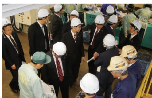
北部クリーンセンターで説明を受ける

が提供されるよう努めることは行政の役割です。他の関係省庁とも連携しながら、今後どのように食品関係業者に対し正しい表示知識とコンプライアンスの徹底を指導され、市民の食の安全・安心の確保を図っていかれるのかお聞かせください。