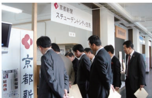
学生シティ・ファイナンスパーク

自民党市議団は市内施設（北部クリーンセンター、学生シティ・ファイナンスパーク、工業技術センター）の調査活動により、政策提言を行なっております。