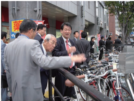
歩道に駐輪場を設置したケース