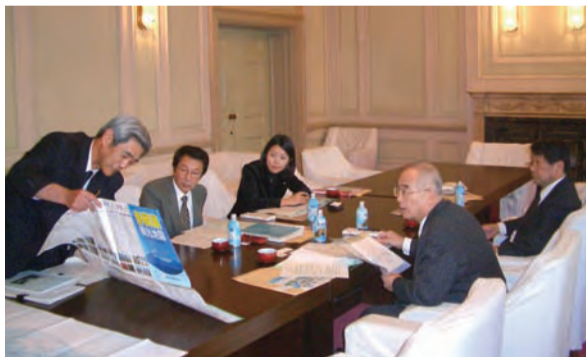
(写真上から)特別委員会第一分科会、同第二分科会、公営企業特別委員会の自民党議員団