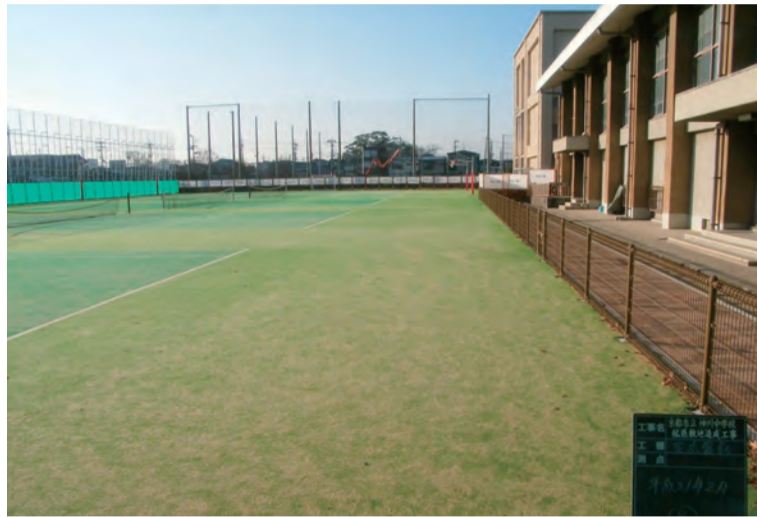
拡充整備が進む神川中学校のグラウンド

今予算は 私を先頭に 市の総力を 挙げた「知 恵と汗の予 算」であり、 未来の京都 のまちづく りを本格的 に展開する 「セーフティ ネットと未 来志向の予 算」が出来 上がったと 自負してお ります。