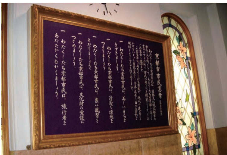
市役所玄関に掲げられている「京都市民憲章」額