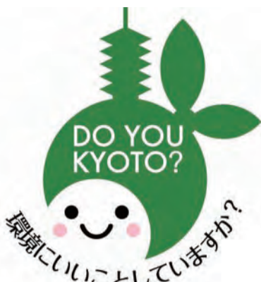
「DO YOU KYOTO?」のマスコットキャラクター「エコちゃん」

「自民党議員団ニュース」は京都市民の皆様が京都市政についてわかりやすくお伝えすることを主眼に、幅広く市政に関する調査を行い、政策提言してまいりました。 今号は、京都市が市民の皆様親し