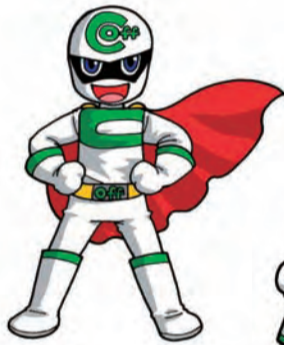
正義の味方「クーリング・オフマン」

をもったいただこうと生み出された、さまざまなキャラクターを集めた。中には「こんなキャラクター知らない」といった声も聞かれますが、キャラクターをきっかけにその分野の政策に関心を持っていただけだと思います。